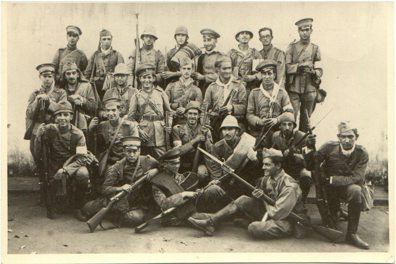
Combatentes paulistas, suas vestimentas e armas

Entretanto, o governo federal tinha armas melhores e mais soldados. Utilizaram aviões para bombardear cidades do interior paulista.