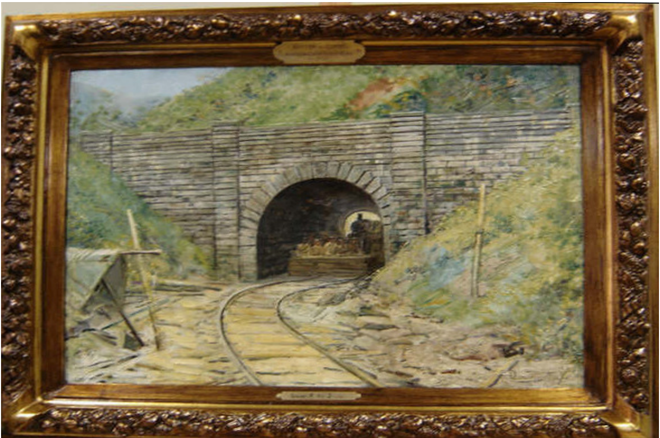
Pintura à óleo do pintor brasileiro, Oscar Pereira da Silva, sobre a defesa do túnel de Cruzeiro , na Serra da Mantiqueira, em São Paulo , ponto estratégico defendido pelas tropas paulistas durante a Revolução Constitucionalista de 1932 .