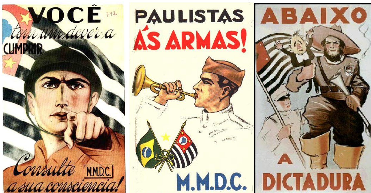
Cartazes da época conclamando os paulistas combaterem a ditadura de Vargas

Dois meses mais tarde, justamente no dia 9 de julho de 1932, explodiu a revolta dos grupos constitucionistas.