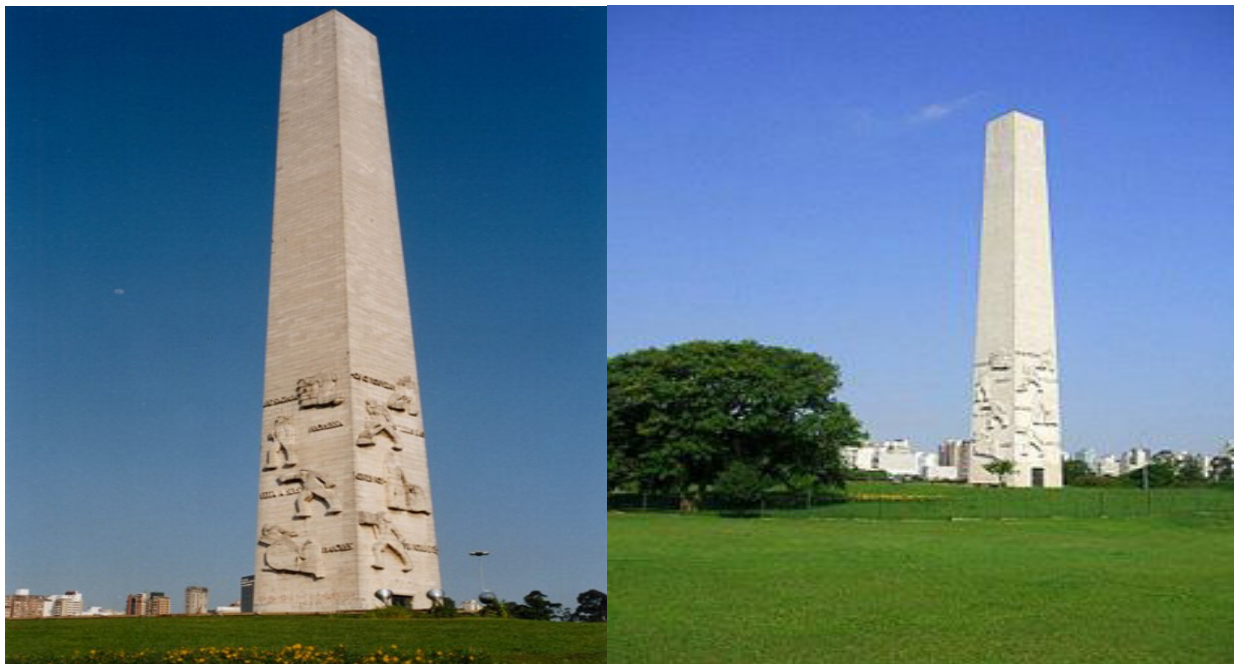
Obelisco em São Paulo no Parque Ibirapuera em homenagem aos soldados constitucionalista de 1932

Apesar da derrota paulista em sua luta por uma constituição, dois anos depois da revolução, em 1934, uma assembléia eleita pelo povo promulga a nova Carta Magna.