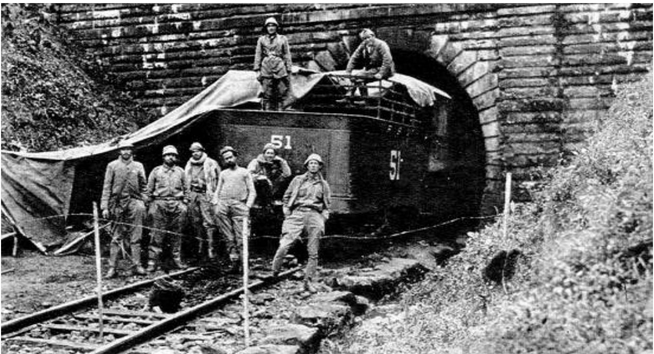
Defesa do túnel de Cruzeiro, na Serra da Mantiqueira, em São Paulo

No rádio, o entusiasmo de Cesar Ladeira faz dele o locutor oficial da Revolução Constitucionalista . Uma intensa campanha de mobilização é acionada. A população adere à rebelião.